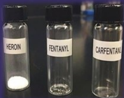
bežná smrteľná dávka